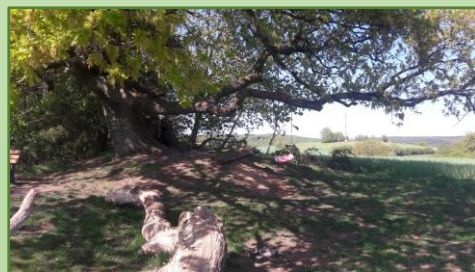
7 - alte Eiche (Zugang von Herrmannstraße über Rosenlehrpfad oder Zur Weinstraße, zw. Ockershausen und Wehrshausen) Große ausladende Äste, Schaukel, Tolle Aussicht Sitzbänke, Picknickplatz

Bitte geht mit allen Bäumen sorgsam um ☺ Vielen Dank und viel Freude in der Natur!