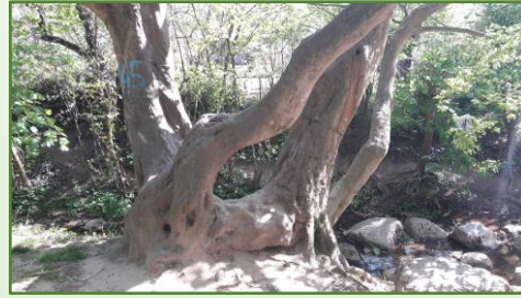
5 - Buche im Northamptonpark (Zugang vom Radweg an der Hirsenmühle, gegenüber Spielplatz) Für Kleinere spannend Am Wasser