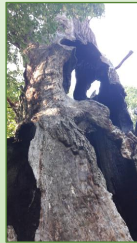
6 - Heilige Eiche/ Förster Eiche (Zugang über Amöneburger Straße/ Wanderwege) Hohler Baum, von innen begehbar Spannend, verkohlte Stellen, wie Höhle, Parkplatz daneben